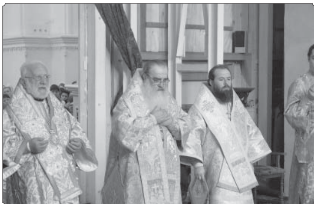
За Божественной литургией в Свято-Успенском соборе Киево-Печерской Лавры.

Религиозное движение народов стало отличительной чертой начала третьего тысячелетия от Рождества Христова. И потому одной из наиболее общих тем, размышления о которой пронизывает весь корпус книги, является вопрос автора к самому себе, к своему клиру и к пастве, ко всей христианской экумене: « Жизнеспособно ли христианство? »